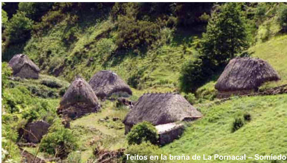
Teitos en la braña de La Pornacal – Somiedo