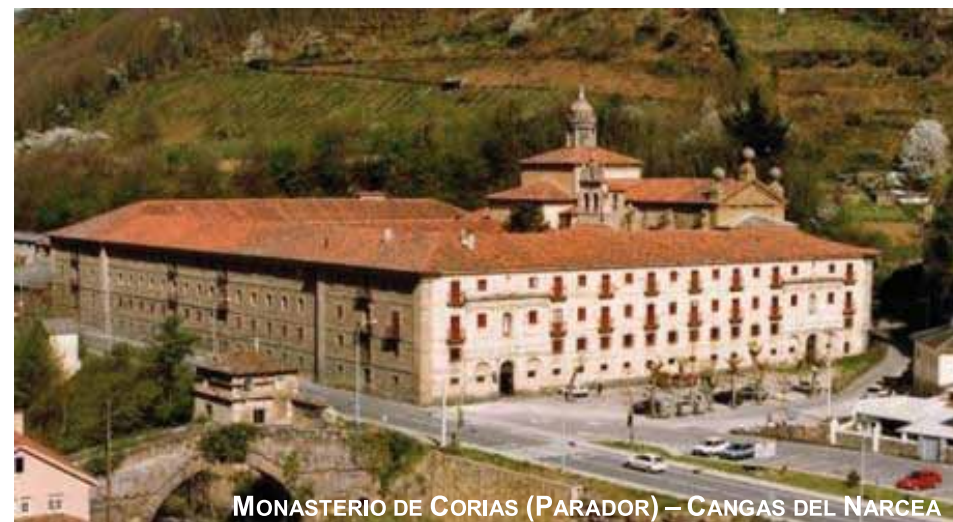
MONASTERIO DE CORIAS (PARADOR) – CANGAS DEL NARCEA

VIAJE CULTURAL A CANGAS DE NARCEA, IBIAS Y DEGAÑA